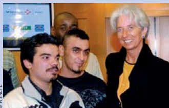
La mobilité des apprentis en Europe est l'une des priorités de Christine Lagarde, ministre de l'Économie, des Finances et de l'Emploi.

Lors du colloque organisé par l'APCM lundi 28 janvier sur la mobilité européenne des apprentis, Christine Lagarde, ministre de l'Économie, des Finances et de l'Emploi, a rendu public, dans un message diffusé aux participants, la décision du gouvernement de faire de la mobilité des apprentis une de ses priorités dans le cadre de la présidence française de l'Union européenne. La ministre a annoncé qu'un grand rassemblement aurait lieu en 2008, réunissant des milliers d'apprentis venus de toute l'Europe pour se retrouver, échanger et travailler ensemble. Ce rassemblement, ainsi que la Conférence consacrée aux entreprises artisanales contribueront à mettre l'Artisanat au cœur de la Présidence française de l'UE.