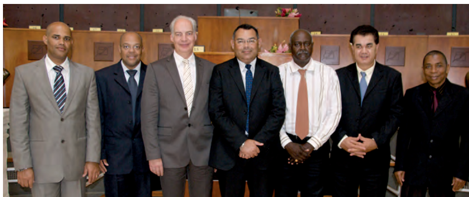
Le Président de l'APCM entouré des présidents des CMA d'Outre-Mer.

En réunissant du 3 au 6 novembre dernier, en Guadeloupe, la conférence interrégionale des métiers et de l'artisanat d'Outre-Mer, COIREMA, les chambres de métiers et de l'artisanat ont lancé le coup d'envoi d'une vaste concertation collective sur deux grands sujets d'actualité. Le premier concerne l'application de la révision générale des politiques publiques dans leur territoire. Le deuxième est relatif à la mise en œuvre du contrat d'objectifs et de moyens entre le ministère de l'Outre-Mer et les CMA d'Outre-Mer.