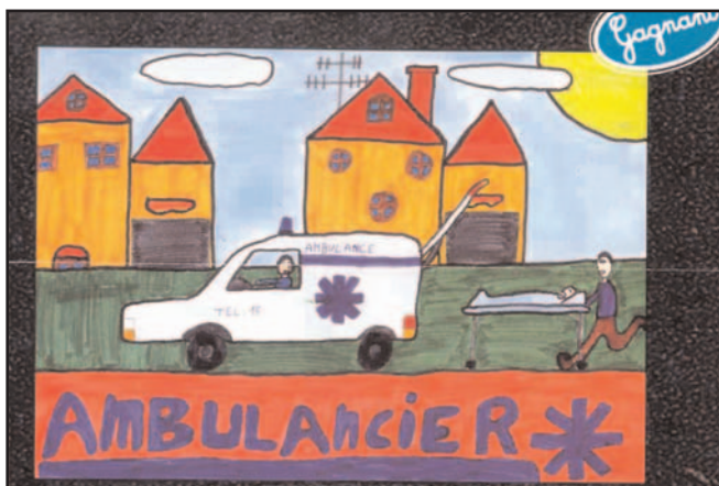
Gagnant de l'école Les Charmilles à Grenoble