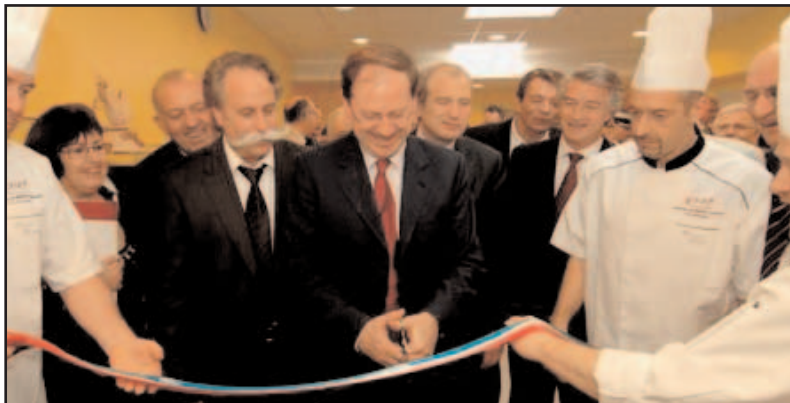
Hervé Novelli inaugure la CFA d'Eschau

Hervé Novelli s'est rendu le 24 avril dernier en Alsace à la rencontre des artisans de la région. Il a visité le centre de formation d'apprentis (CFA) d'Eschau totalement rénové. Un programme ambitieux de restructuration sur trois ans vient de se terminer. Hervé Novelli a souligné la qualité de ce " nouveau " centre équipé d'infrastructures modernes. Il offre aujourd'hui un enseignement adapté