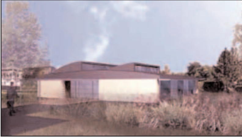
Les nouveaux locaux HQE du CNIDEP

Créé en 1993 par la chambre de métiers et de l'artisanat de Meurthe-et-Moselle, le service aux artisans en matière d'environnement était à l'époque le premier du genre en France au sein du réseau des CMA. En juin 2003, la CMA de Meurthe-et-Moselle obtient le label " Pôle d'innovation technologique de l'artisanat " délivré par l'Etat. Le CNIDEP