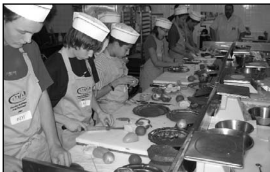
Des collégiens apprennent une recette dans une entreprise artisanale des Landes

Contact : Claudine Vidal - c.vidal@cma-40.fr