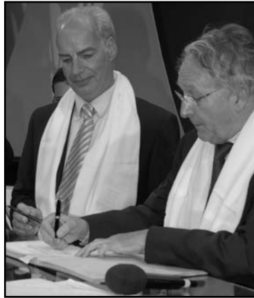
Le président Alain Griset et Daniel Percheron, président du Conseil régional du Nord-Pas-de-Calais.

Autre volet du plan, les mesures prises en faveur du financement des entreprises: un prêt à taux zéro pour la création et la transmission et un système de caution mutuelle auprès des banques garantissant jusqu'à 70 % d'un prêt. Dans les communes rurales de moins de 2 000 habitants et dans les quartiers urbains