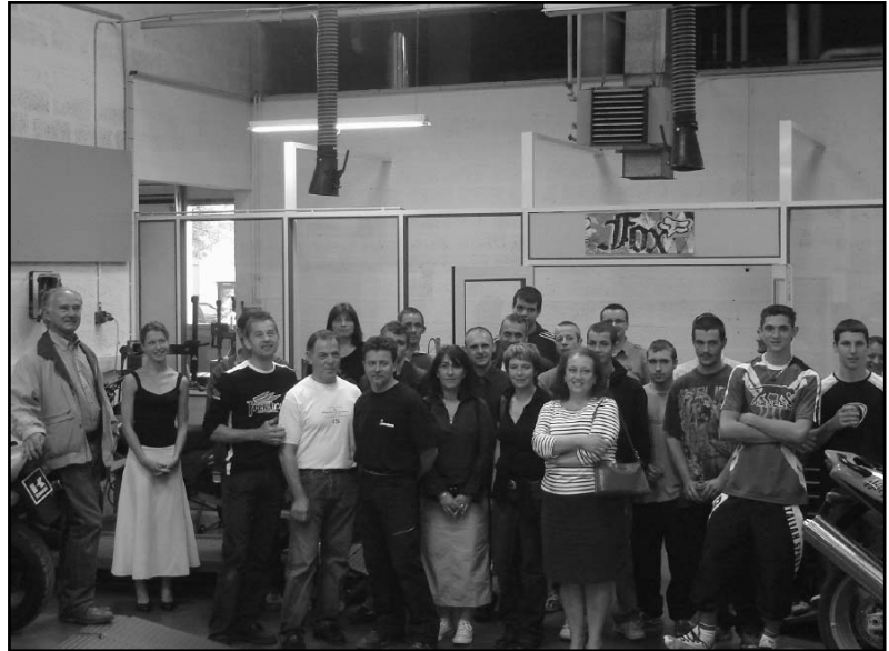
Ce jour-là, l'atelier des motocycles du CFA a ouvert ses portes pour une visite et un échange convivial.

Contact : Amandine Piquet - amandine.piquet@cfa-erier.com