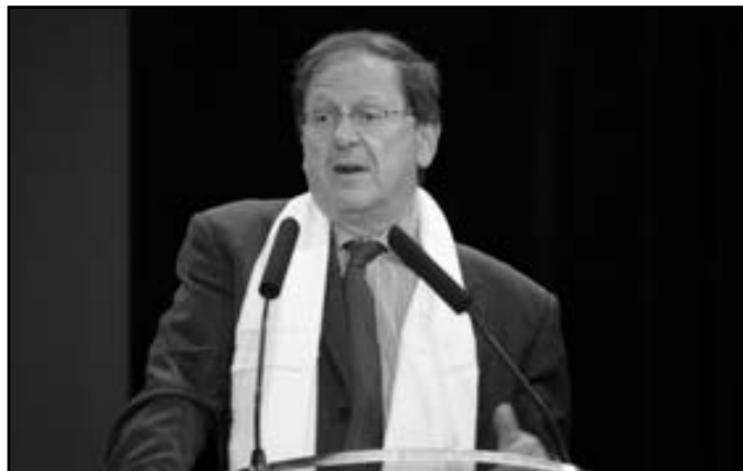
Hervé Novelli, secrétaire d'Etat aux entreprises et au commerce extérieur

Réunis à Lille à l'occasion des deuxièmes assises de l'artisanat, plus de 1200 artisans ont pu dialoguer pour la première fois, depuis son entrée au gouvernement, avec Hervé Novelli, secrétaire d'Etat aux entreprises et au commerce extérieur.