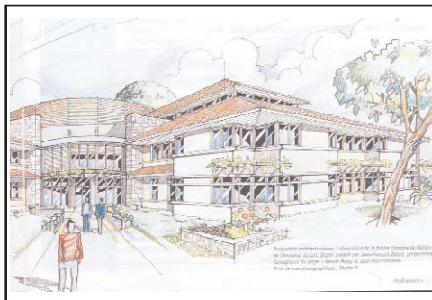
Perspective architecturale en trois dimensions de la future Chambre de métiers et de l'artisanat du Lot

Projet majeur de la mandature de Serge Crabié, président de la Chambre de métiers et de l'artisanat du Lot, la nouvelle chambre consulaire s'inscrit dans le cadre d'un nouveau pôle qui devrait permettre de créer un concept fort, celui de la « Cité des métiers et de l'artisanat », regroupement de l'ensemble des services proposés aux entreprises artisanales sur un même site. La construction à l'horizon 2008 de la nouvelle compagnie consulaire devrait permettre de renforcer la synergie avec l'école des métiers, pour une meilleure visibilité des services de la chambre.