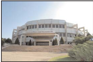
Les nouveaux locaux

manipuler la souris et de connaître les diverses fonctionnalités d'un ordinateur. Cette formation aura lieu les lundis, du 29 janvier au 12 février 2007 dans les locaux de la chambre de métiers et de l'artisanat de l'Ain.