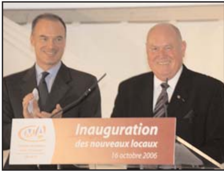
Renaud Dutreil, ministre des PME, du commerce, de l'artisanat et des professions libérales et William Forestier, président de la CMA de la Côte-d'Or

Pour mieux servir encore l'artisanat, la chambre de métiers et de l'artisanat de la Côte-d'Or a pris possession en novembre 2005 de nouveaux locaux à Dijon. Ce sont plus de 2400m 2 entièrement dédiés à l'artisanat du département avec des salles de réunion, des salles de formation pour les stages informatiques... Une année a été nécessaire pour s'installer et prendre ses marques. L'inauguration a eu lieu le 16 octobre 2006 en présence du ministre Renaud Dutreil.